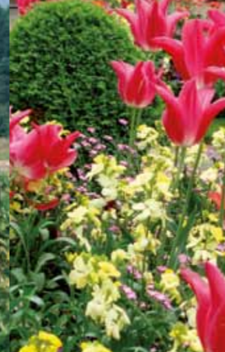
Detail van de bloemenperken in het park Ronsard.