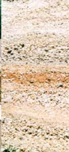
Kalkrotsen aan de zuidkant van de wijngaarden.