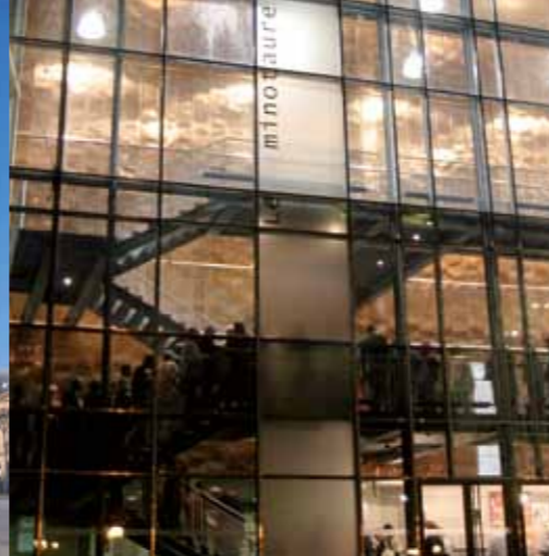
Detail van de koperen wand van le Minoature, de deur Gaëlle Péneau ontworpen schouwburg.