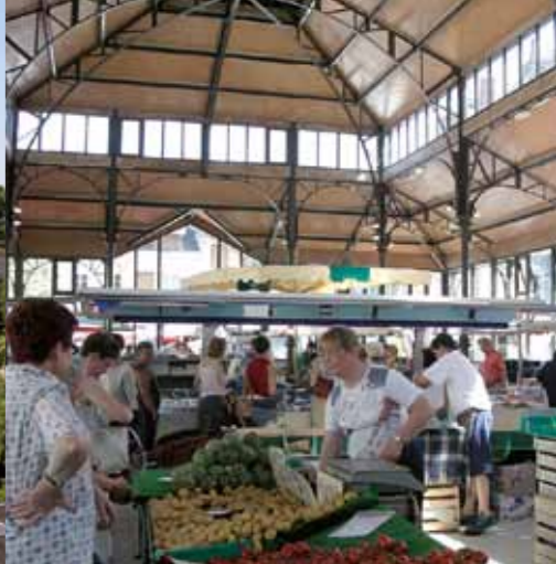
Elke vrijdag is er in de hallen een gezellige markt.