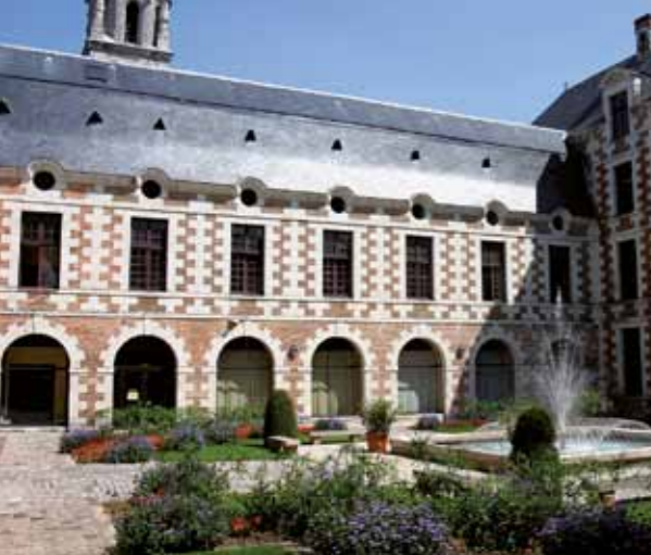
Het binnenplein van het stadhuis.

Ontdek de historische plekken Van de tuin van het voormalig college met zijn trotse platanen tot aan de oevers van de Loir.