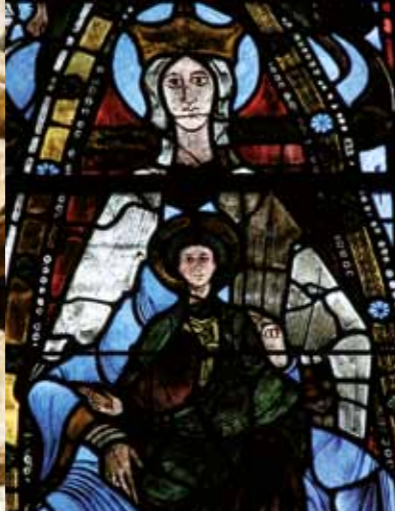
De Maagd met het Kind, glas-in-loodraam rond 1125 in de abdij van la Trinité.