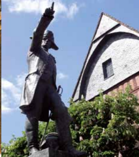
De maarschalk van Rochambeau, geboren in Vendôme, door F. Hamar.