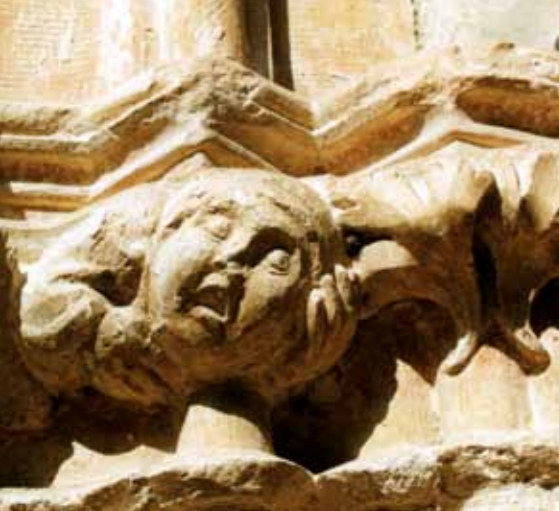
Beeldhouwwerk in de kapittelzaak.

Wandel door de straatjes in de stad en werp een nieuwsgierige blik op alle monumenten. Deze wandeling vertelt u alles over de geschiedenis van de stad.