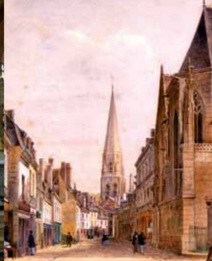
De rue du Change in 1856, aquarel van Gervais Launay.

Via 2 verschillende rondwandelingen kunt u de oude binnenstad van Vendôme beter leren kennen. Het vertrekpunt voor beide wandelingen is het VVV en ze vullen elkaar aan, zodat u ten volle kunt genieten van de rijkdom van dit stedelijk erfgoed.