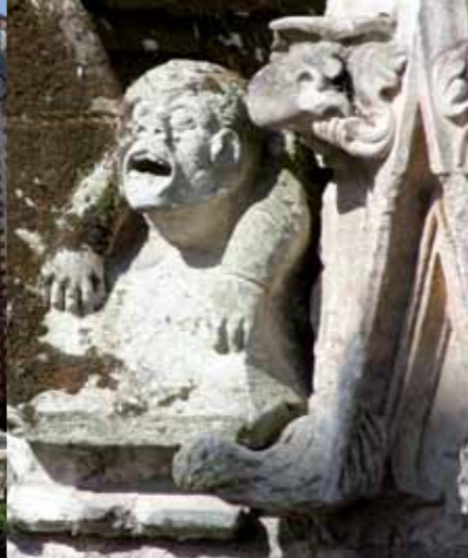
Gebeeldhouwd detail van de kapel Saint-Jacques.