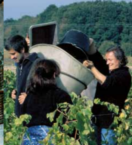
Wijnoogst op de heuvel van Les Coutis.