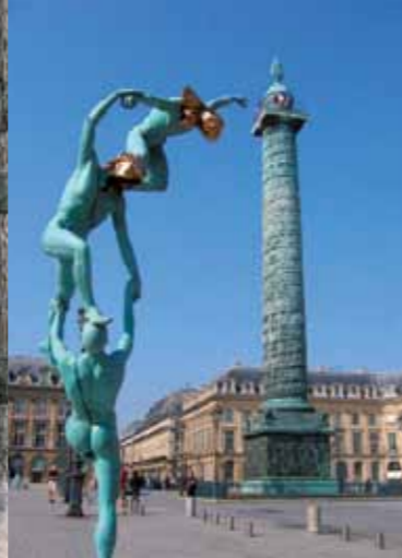
Hoewel het herenhuis van de hertogen van Vendôme vernietigd is toen het koninklijke plein aan het eind van de XVIIIe eeuw verbouwd werd, draagt dit Parijse plein nog steeds hun naam.