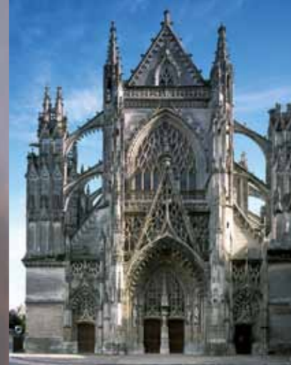
Flamboyant gotische façade van de abdij van de Trinité.