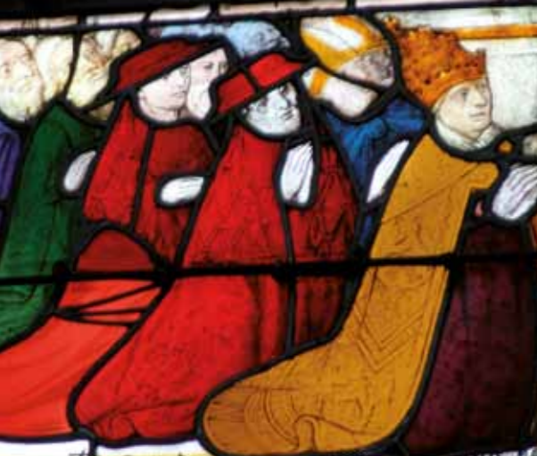
Kardinalen en religieuzen, detail van een glas-in-loodraam van de abdij van de La Trinité.

Topografisch en historisch woordenboek van de bevolking en het arrondissement Vendôme