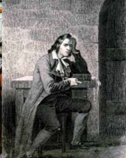
Gracchus Babeuf, één van de sympathisanten van de "Conspiration des égoux", terechtgesteld en geëxecuteerd te Vendôme in mei 1796.