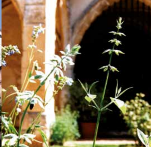
Vele botanische variëteiten (hier een salvia discolor ) groeien en bloeien in de geurige tuin van kloosterhof.