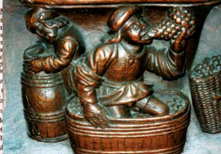
Gebeeldhouwde wijnbouwers aan het eind van de XVe eeuw in de koorstoelen van la Trinité.