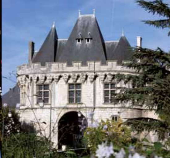
In de Saint-Georges poort worden al sinds 1467 raadsvergaderingen gehouden.