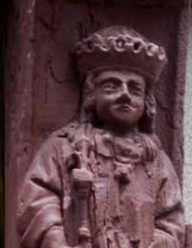
De heilige Louis op het huis Saint-Martin.