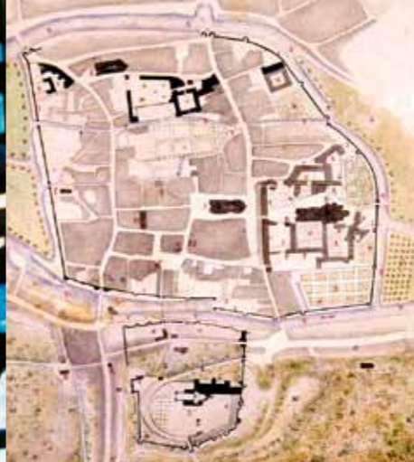
Vendôme in de XVIIe eeuw overgenomen door Gervais Launay in de XIXe eeuw..