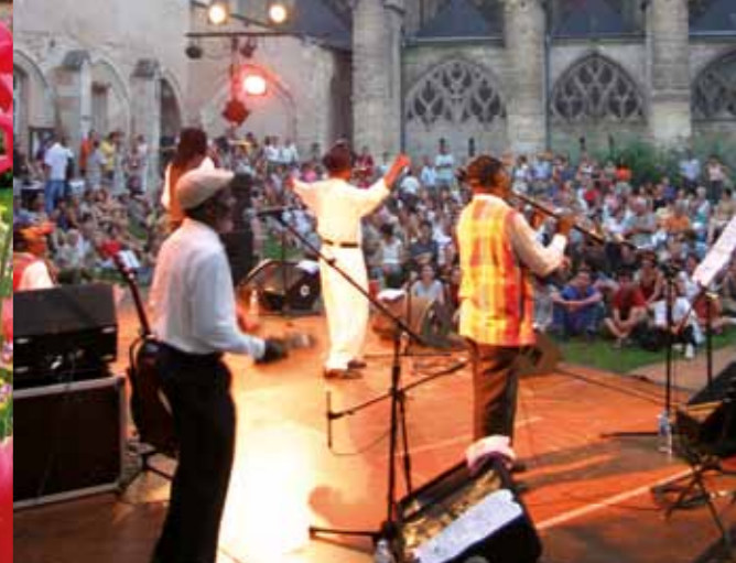
Concert in de zomer.