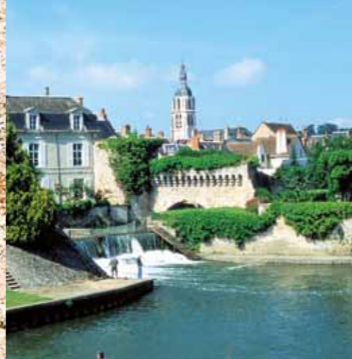
De waterpoort of de Arche des Grands-Prés die over de Loir staat.