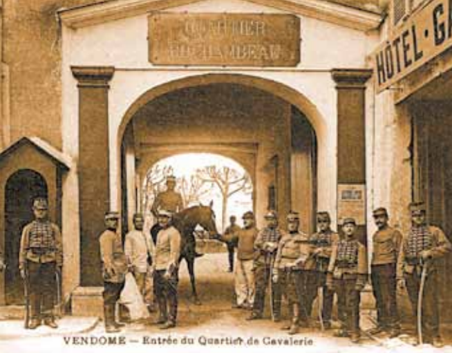
Soldaten van de 20e regiment "Chasseurs à cheval", voor de wijk Rochambeau in de oude abdij van la Trinité.

Van het oude benedictijner klooster tot de poorten van de stad... Al deze pittoreske plekjes hebben een eigen verhaal.