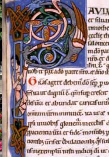
Een van de 232 middeleeuwse manuscripten in de bibliotheek van Vendôme. Dankbetuiging van de heilige Paul (Ms 23 - F.165 - XIIe eeuw).