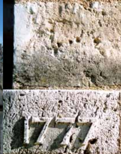
Detail van het oude college van de Oratorianen.