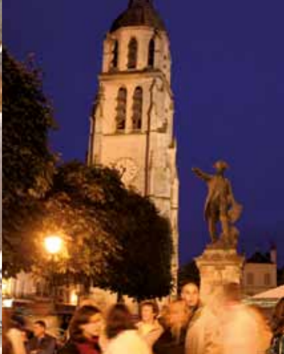
Het klokkenspel van de toren Saint-Martin loopt op het ritme van de uren en van de harten van de inwoners van Vendôme.