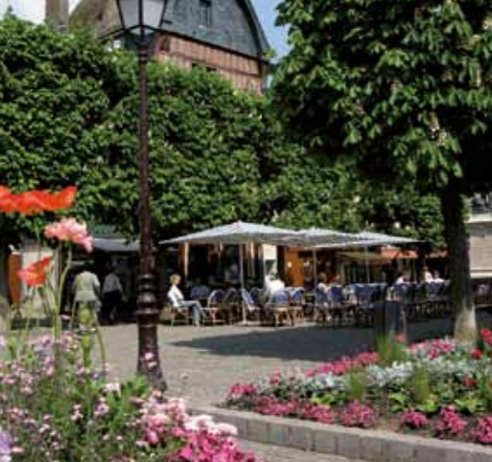
Het plein Saint-Martin, in het centrum van de stad.

Pierre de Ronsard (1524-1585) "Odelette du Bocage" uit 1554 - Livres des odes de jeunesse.