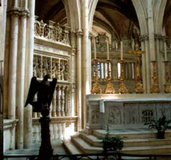
Het koor van de abdij van de Trinité.