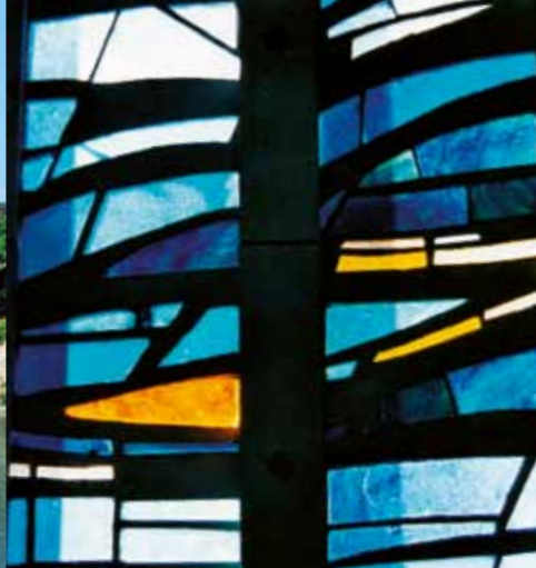
Eigentijds glas-in-loodraam door Anne Huet, in de kerk Notre-Dame-des-Rottes.