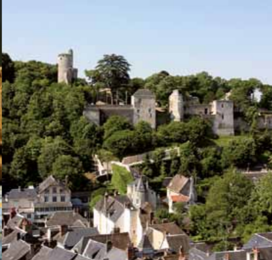
Aan de zuidkant van de wijngaarden wordt de stad gedomineerd door het kasteel en het park.