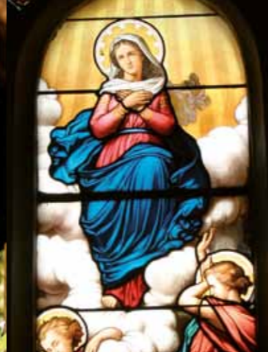
Glas-in-loodraam uit de XIXe eeuw van Maria tenhemelopneming, atelier Lobin, de kerk La Madeleine.