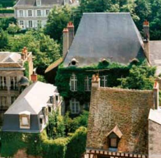
Balzac heeft zich geïnspireerd op één van de herenhuizen in de rue Guesnault voor de geschiedenis over la Grande Bretèche.

Sinds de jaren 1980 - 1990 breidt de stad zich meer en meer uit naar het zuiden, waar voorheen de wijngaarden een natuurlijke grens vormden. Er worden in het zuiden plannen gemaakt voor urbanisering, in de wijk Aigremonts (oorspronkelijke betekenis "steile heuvels"). Deze urbanisering zorgt voor een evenwichtige verdeling van bevolking en activiteiten in een stad die inmiddels 18 500 bewoners telt, en die het centrum vormt van een regio met meer dan 30 000 inwoners.