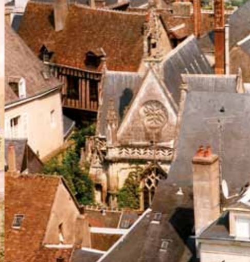
De privékapel Notre-Dame-de-pitié.