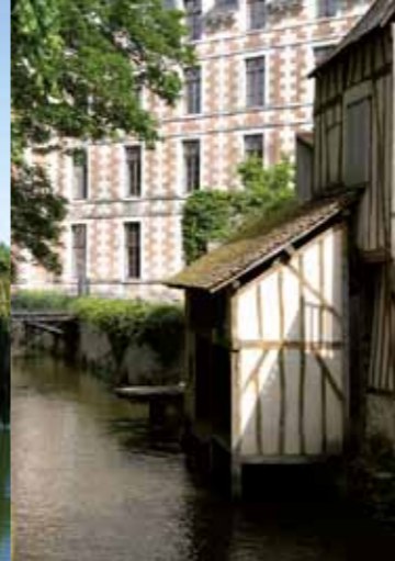
De wasplaats van Les Cordeliers (eind XVe eeuw).