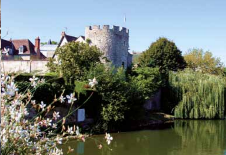
De toren van l'Islette.