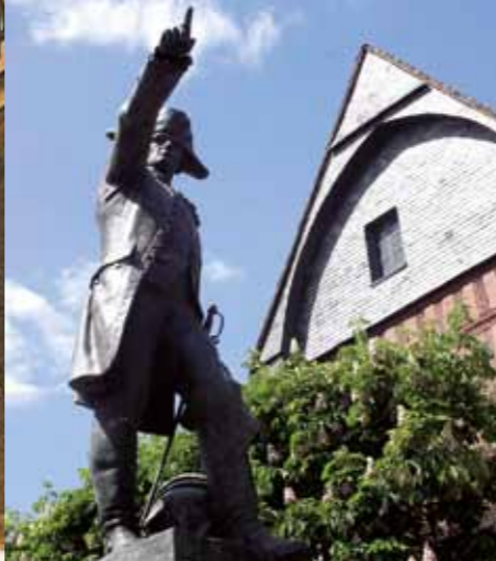
El mariscal de Rochambeau, nacido en Vendôme, por F. Hamar.