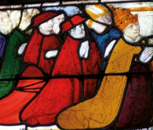
Cardenales y religiosos, detalle de un vitral de la iglesia abacial de la Trinité.

Situada a más de 120 km de París, distancia considerada necesaria para que un tribunal pueda juzgar con serenidad en período revolucionario, Vendôme recibe a la Alta Corte de Justicia para el proceso de Gracchus Babeuf, Augustin Darthé y sus partidarios. Finalmente, los tumultuosos debates que, durante más de siete meses, animan las audiencias (¡y la ciudad!) tienen como desenlace la ejecución de los dos principales acusados y la deportación de la mayoría de sus simpatizantes. El año 1796 marca la detención de los cabecillas de "La Conspiración de los Iguales" pero sus ideas se renovarán y reaparecerán después de la Revolución de 1830.