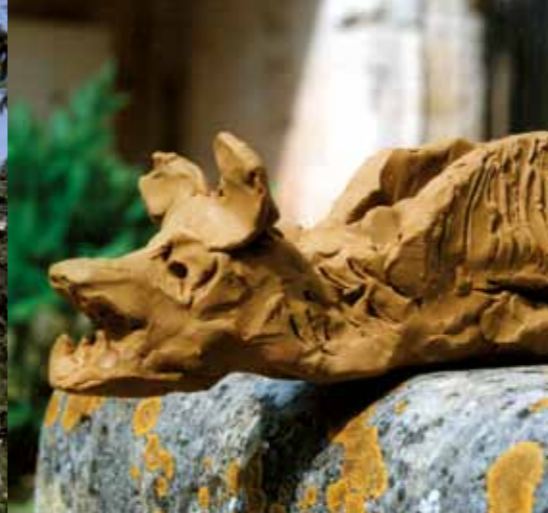
Gárgola modelada en barro durante un taller para niños.