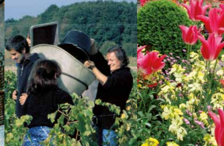
Vendimia en la ladera de Coutis