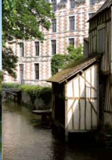
El lavadero de los Cordeleros (fines del siglo XV).