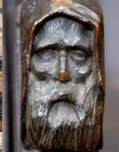
Monje esculpido de las sillas del coro de la Trinité.