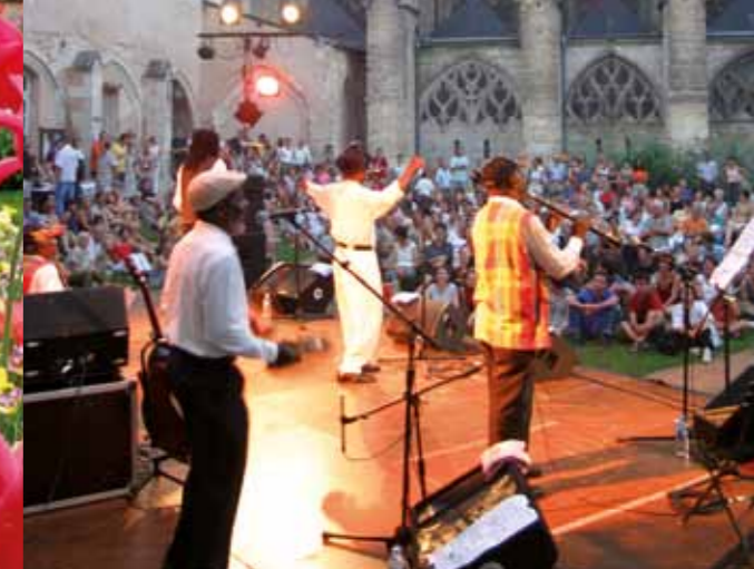
Concierto de las "Rendez-vous de l'été" (Citas del Verano).