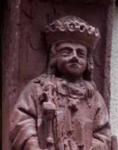
San Luis en la casa Saint-Martin.